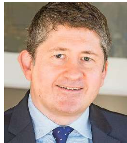
«Wir bevorzugen Lokalwährungsanleihen gegenüber Dollarbonds.»

Steigen die Zinsen, nimmt die Zinslast verschuldeter Unternehmen zu. Wie schätzen